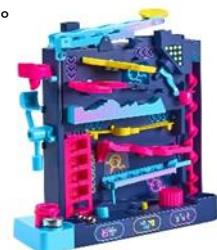
「Screwball Scramble」Level Up