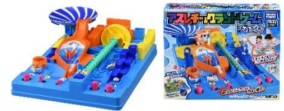
2023年発売 「アスレチックランドゲーム シーアドベンチャー」

海外で展開している「Screwball Scramble (スクリューボール スクランブル)」は、1980年から展開し、現在までアメリカ・イギリス・フランス・ドイツなど様々な国と地域で定番の商品として楽しまれています。