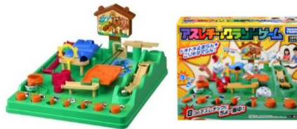
2022年発売の 「アスレチックランドゲーム」