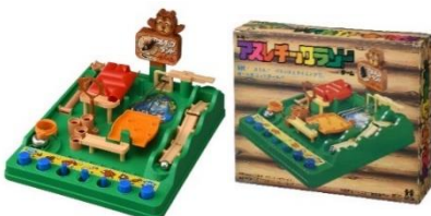
1979年発売の 「アスレチックランドゲーム」

そして、2022年3月に「アスレチックランドゲーム」は復活し、その後、2023年3月には「海」をテーマにした「アスレチックランドゲーム シーアドベンチャー」を展開しています。