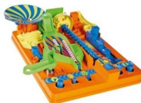
「Screwball Scramble」Level 2