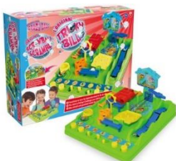
海外で展開中の「Screwball Scramble」とパッケージ

海外で展開している「Screwball Scramble (スクリューボール スクランブル)」は、1980年から展開し、現在までアメリカ・イギリス・フランス・ドイツなど様々な国と地域で定番の商品として楽しまれています。