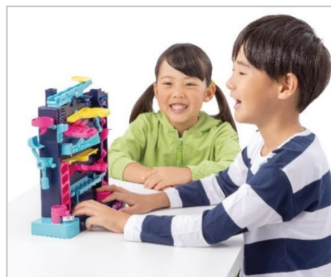
上) 遊んでいる様子 左) 「アスレチックランドゲーム レベルアップ」

「アスレチックランドゲーム レベルアップ」のテーマは「昭和レトロなテレビゲーム」で、どこか懐かしい雰囲気イメージして開発しました。今までは平面のステージだった「アスレチックランドゲーム」シリーズですが、 本商品は迫力満点な高さ約30cmの高くそびえたつ立体的縦型コース です。ハラハラドキドキの仕掛けが満載のコースを3つのボタンで操作し、上下にボールを動かしながら10個のアスレチックを乗り越えゴールを目指します。